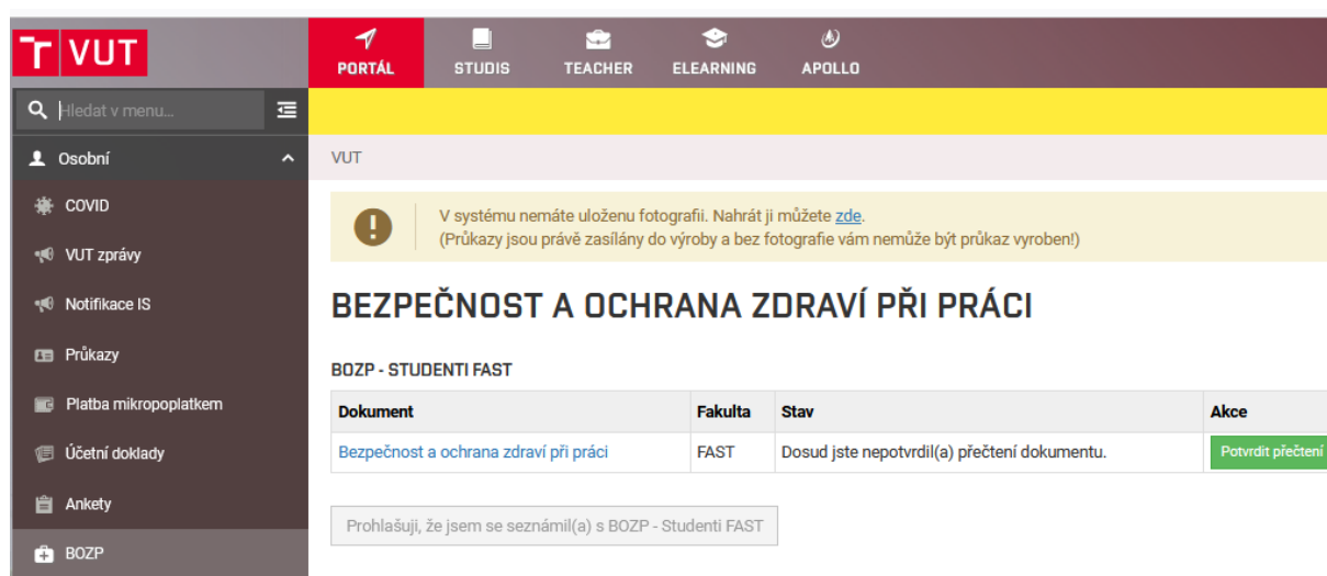
Obr. č. 4: Formulář pro zadání prohlášení o BOZP

V opačném případě musí student elektronicky prohlášení potvrdit. Nejdříve je nutné potvrdit přečtení dokumentu a následně potvrdit prohlášení (obr. 4).