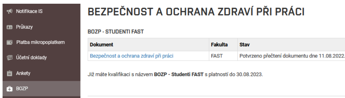
Obr. č. 3: Informace o platnosti prohlášení BOZP

V opačném případě musí student elektronicky prohlášení potvrdit. Nejdříve je nutné potvrdit přečtení dokumentu a následně potvrdit prohlášení (obr. 4).