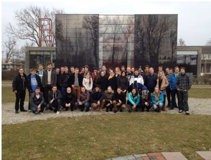
Obr. 1: Hromadné foto před kostelem Sankt-Franziskus, Wels