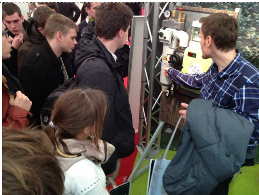
Obr. 2: Praktická ukázka tepelných čerpadel

Název projektu: Středoevropské centrum pro vytváření a realizaci inovovaných technickoekonomických studijních programů Číslo projektu: CZ.1.07/2.2.00/28.0301